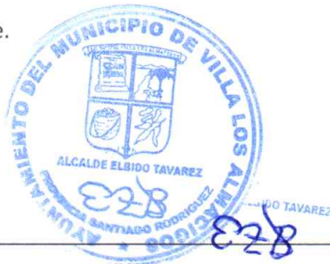
Elbido Tavárez Bautista Alcalde Municipal